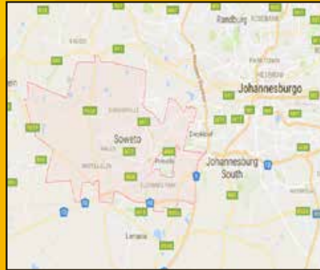
Der Bezirk Soweto, im Süd-Westen von Johannesburg