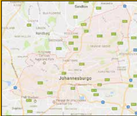
Die Skoon Plaas Siedling im Osten von Johannesburg